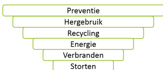
Figuur 1 - Ladder van Lansink 2

Deze factsheet maakt onderdeel uit van het factsheet-dossier essentiële eisen. In deze factsheet vindt u informatie over de Europese Richtlijn voor verpakkingen en de essentiële eisen. Daarnaast wordt er ingegaan op de Nederlandse wet- en regelgeving, bestaande uit het Besluit Beheer Verpakkingen, de Raamovereenkomst Verpakkingen en bijbehorend Addendum.